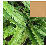
CORDATA 4.86m 2 =187