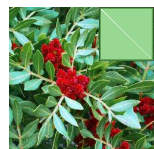
PISTACIA 30.68m 2 =1169