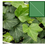
HIEDRA 117.86m 2 =4490