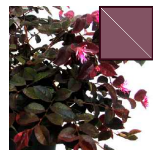
LOROPETALUM 5.41m 2 =208