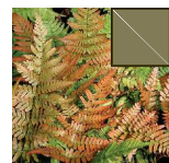
DRYOPTERIS 6.52m 2 =250