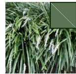
OPHIOPOGON 27.67m 2 =1053