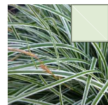
CAREX 13.46m 2 =514