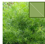
ASPARGUS 38.51m 2 =1465